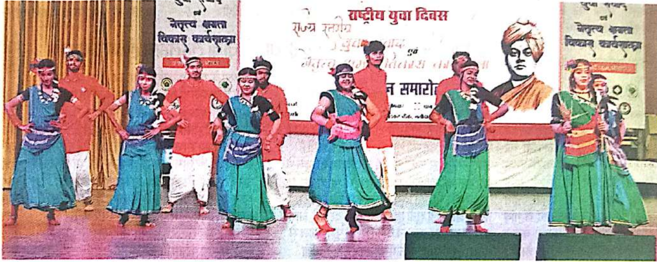
बलौदाबाजार। 'जिला स्तरीय युवा संवाद कार्यक्रम के दौरान सांस्कृतिक कार्यक्रम प्रस्तुत करते हुए एनएसएस के स्वयं सेवक।